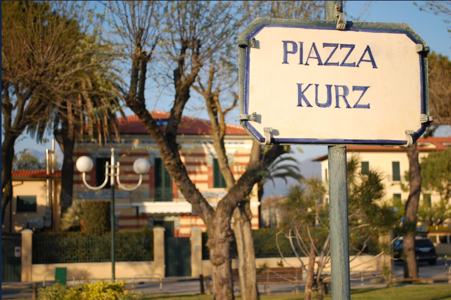
Forte dei Marmi